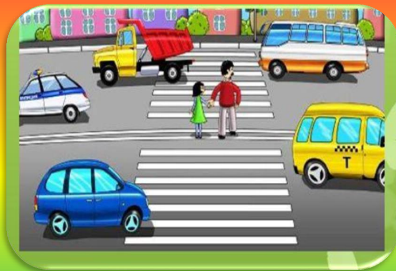
Нерегулируемый пешеходный переход (без светофора)